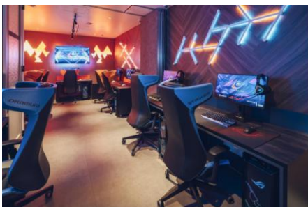
個別ゲームブース MeetUp i